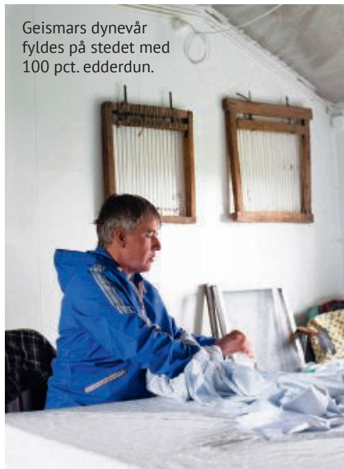
Geismars dynevår fyldes på stedet med 100 pct. edderdun.