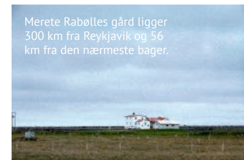
Merete Rabølles gård ligger 300 km fra Reykjavik og 56 km fra den nærmeste bager.