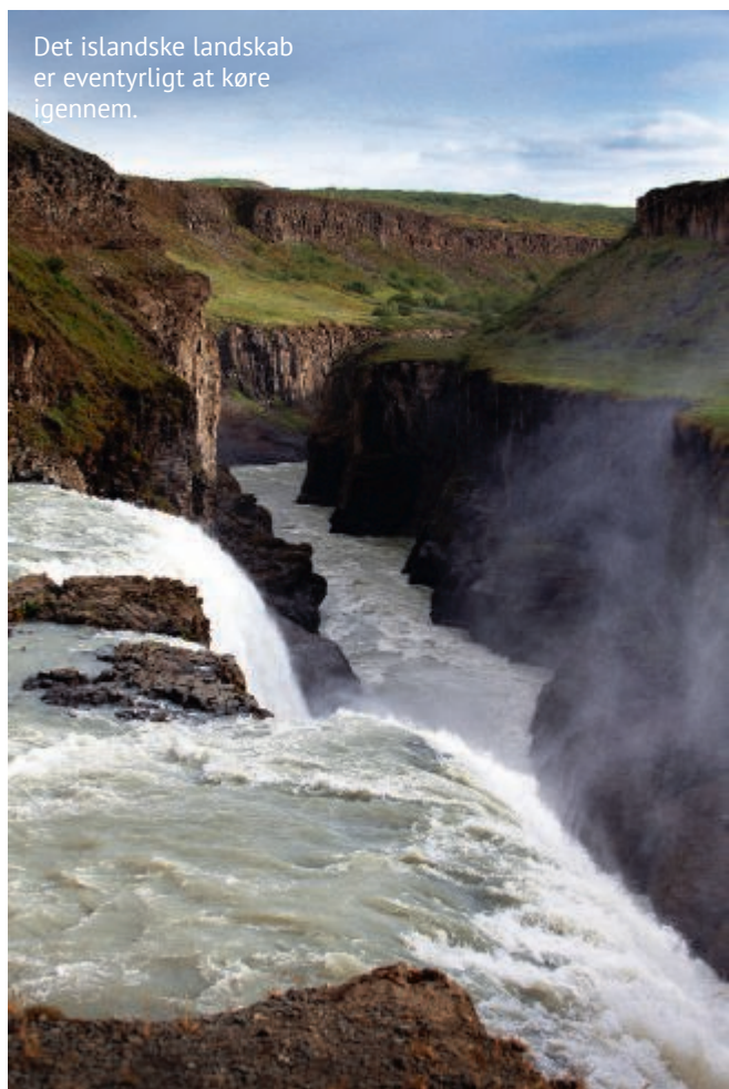
Det islandske landskab er eventyrligt at køre igennem.