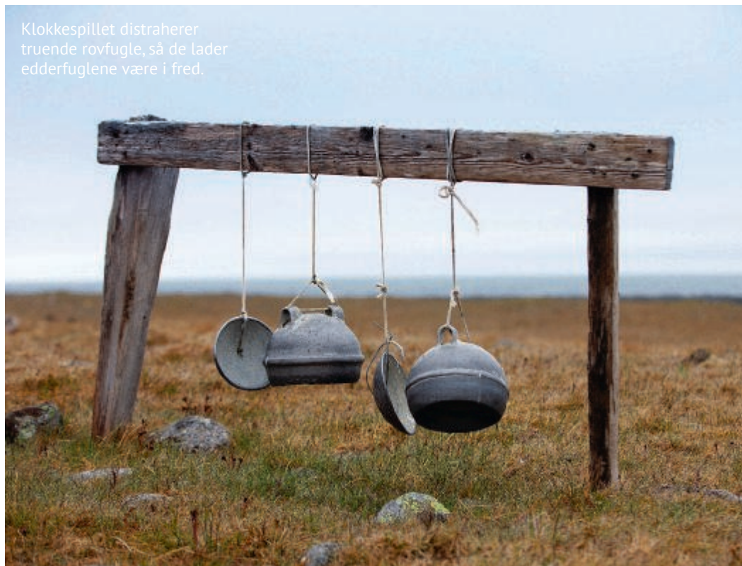
Klokkespillet distraherer truende rovfugle, så de lader edderfuglene være i fred.