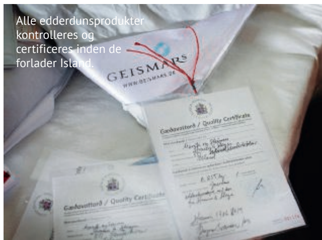
Alle edderdunsprodukter kontrolleres og certificeres inden de forlader Island.