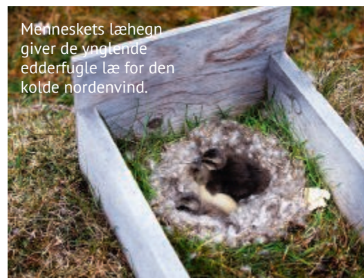
Menneskets læhegn giver de ynglende edderfugle læ for den kolde nordenvind.