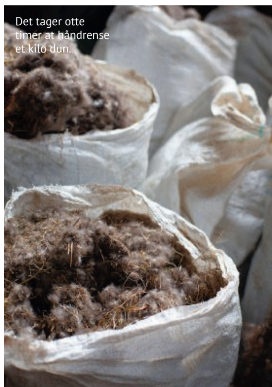
Det tager otte timer at håndrense et kilo dun.