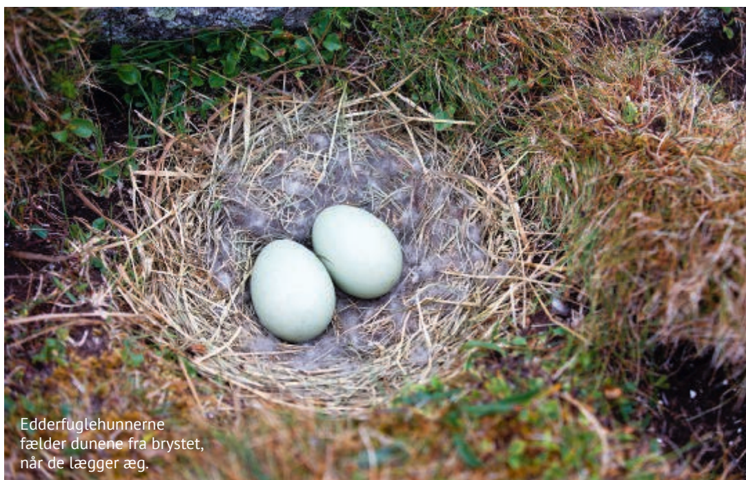
Edderfuglehunnerne fælder dunene fra brystet, når de lægger æg.